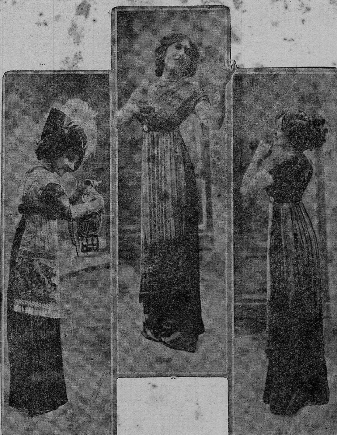
Ultimas creaciones que por su elegancia y lulo están llamando la atención